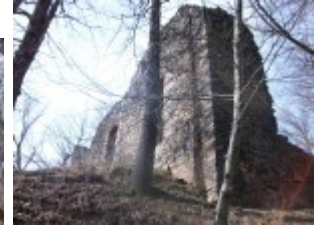
Nur noch das Erdgeschoss ist übrig geblieben.