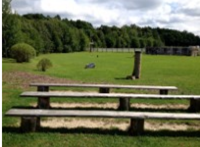
Gelände der Falknerei