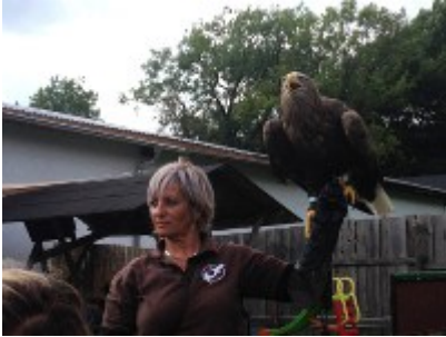
Adler auf dem Arm