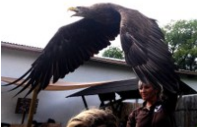
Da fliegt er los

Die Falknerei Herrmann bietet ein wunderschönes Erlebnis-Abenteuer mit täglichen Flugvorführungen von großen Greif- und Wildvögeln . Erleben sie Falken, Adler, Eulen und Bussarde direkt beim Falkner! Die Show dauert etwa eine Stunde.