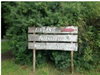
Eingang Falknerei & Naturerlebniszentrum

Sehr imposant ist es, wenn die riesigen Greifvögel nur ganz knapp, weniger als ein Meter, über die Köpfe der Zuschauer hinweg donnern. Vier Kilogramm wiegen die Großen. Staunende Köpfe sind zu sehen, wenn der Falke zum Sturzflug ansetzt und in weniger als einer Sekunde vom Himmel nach unten saust um seine Beute zu erhaschen.