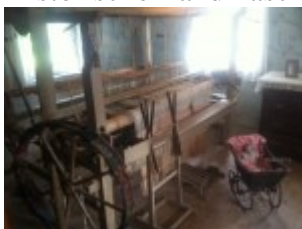
Webstuhl aus Holz