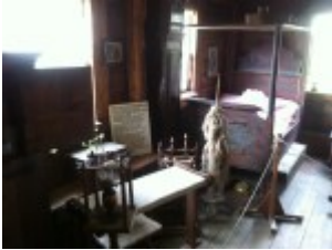
Arbeitsplatz und Schlafraum