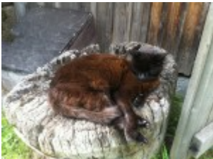
Katze sonnt sich