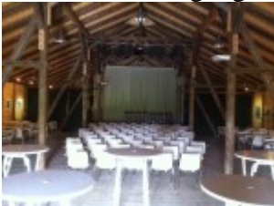
Veranstaltungsraum in der Kulturtenne