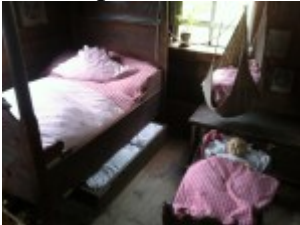
Schlafen auf engstem Raum