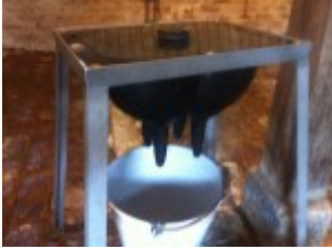
Probiergerät zum Selber-Melken