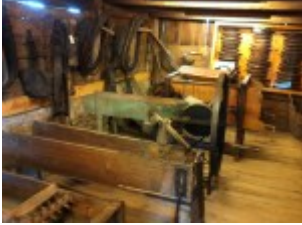
Arbeitsgeräte der Bauern