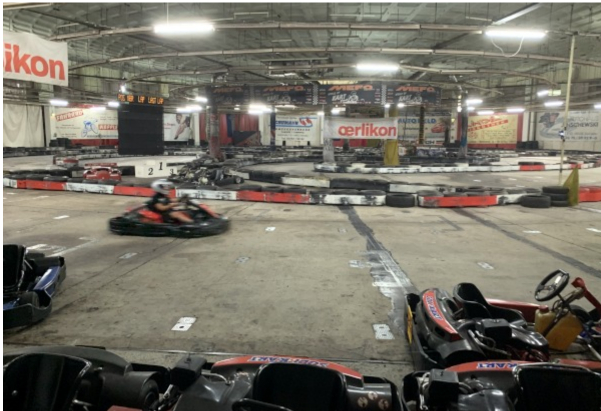
Jagd auf die Bestzeit