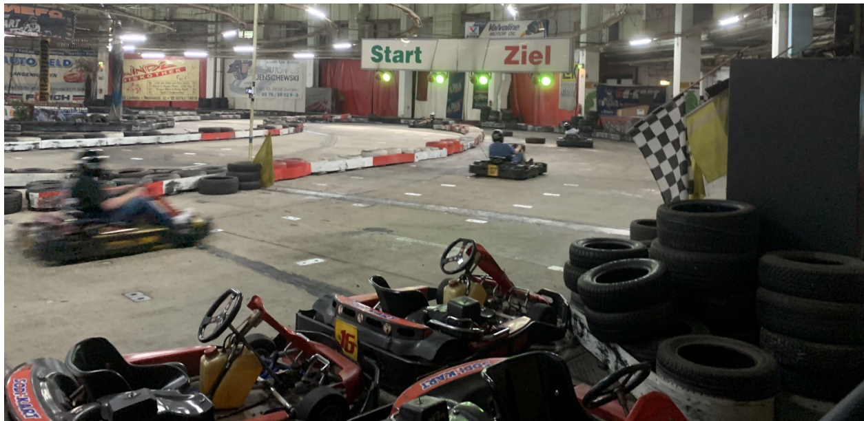
Karthalle Fraureuth - Start/Ziel-Gerade

In dem kleinen Örtchen Fraureuth befindet sich eine wunderbare Go-Kart-Halle . Damit man sich nicht gleich ein Kart selber kaufen muss, kann man hier ein Kart für jeweils 8 Minuten leihen und selber damit fahren. Lasse mit ein paar Kollegen die Reifen quietschen , und zeige ihnen, wer auf der Rennstrecke das Sagen hat!