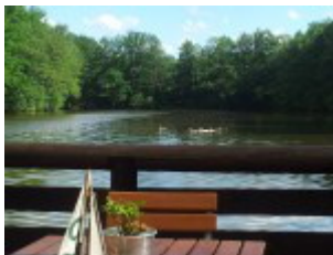
Blick vom Biergarten auf den Teich

Für das Wasser lassen sich Ruderboote sowie Tretboote für jeweils eine halbe oder eine ganze Stunde ausleihen. Kleinkinder erhalten sogar eine Schwimmweste.