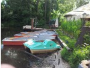
Ruderboote und Tretboot zum Ausleihen