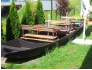
Essen auf dem Boot an Land