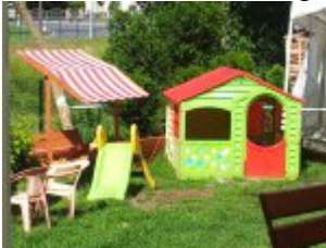
Genug Spielmöglichkeiten sind vorhanden