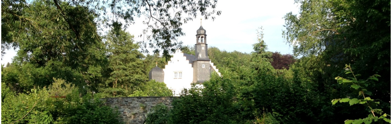
Blick vom Stadtpark durch die Bäume über den Schlossgraben auf das Schlößchen

Wo doch Rodewisch so eine schöne grüne Stadt ist, könnte man fast denken ein extra Stadtpark wäre überflüssig.