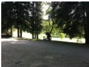
Hier ist's schön.