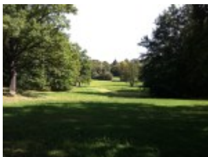
Bäume, Wege und Wiese