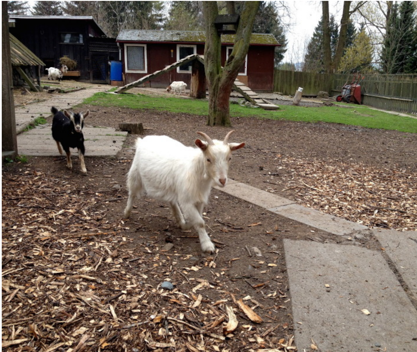
Ziegen mit Häusern und viel Platz

Die Stadt Pausa hat einen schönen Park mit Teich. Der "Eckardts-Park" beherbergt ein Tiergehege. Im Gehege und neben wohnen Ziegen, Enten, Hasen und Esel .