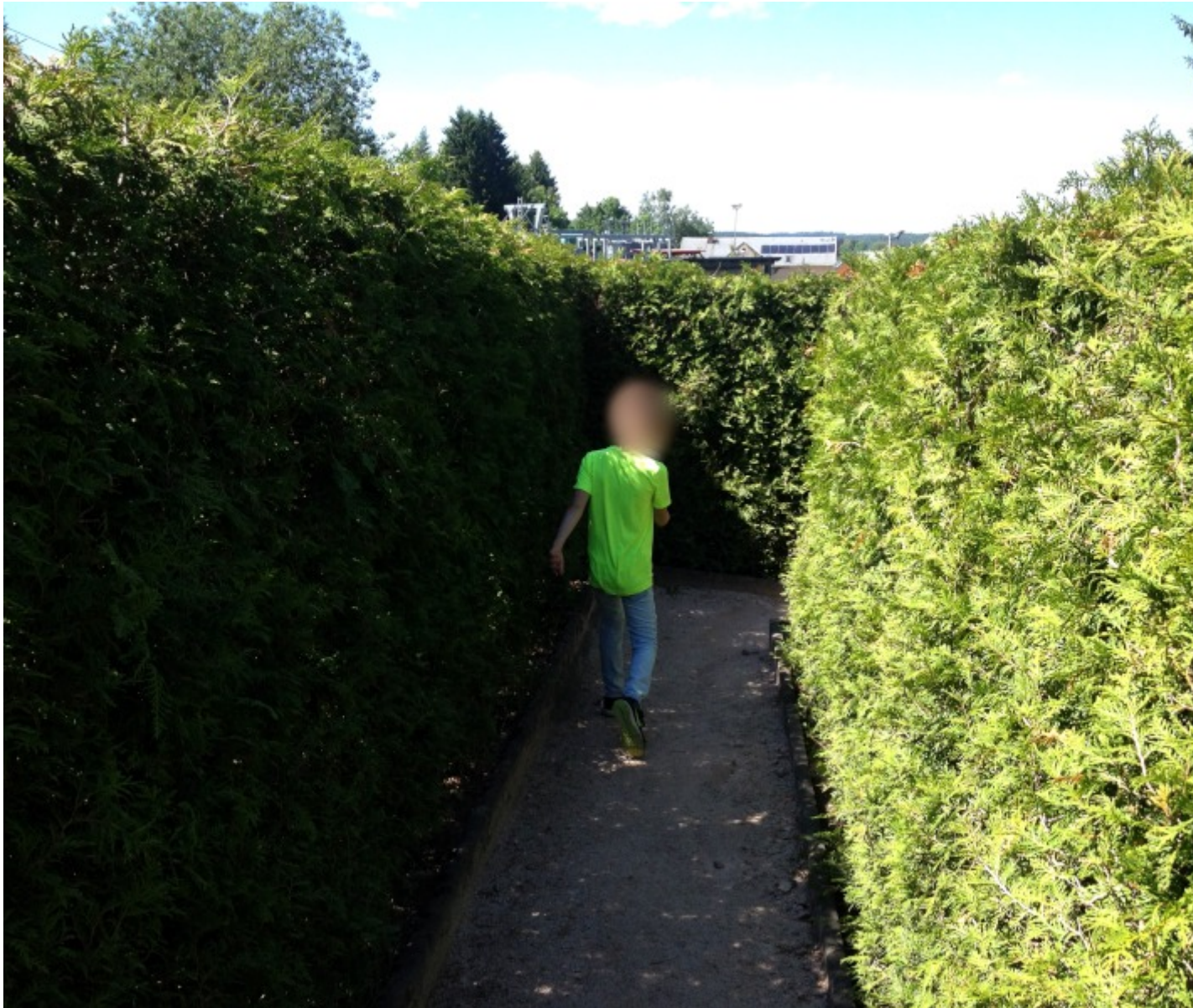
Spannung durch hohe Hecken

In einem echten Irrgarten kann man hier versuchen den Ausgang zu finden. Etwa 2m hohe Hecken begrenzen die Wege.