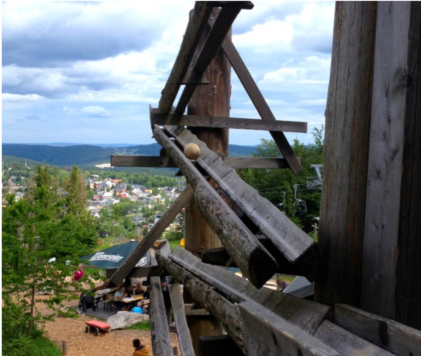
Auf mehreren Ebenen rollt die Kugel