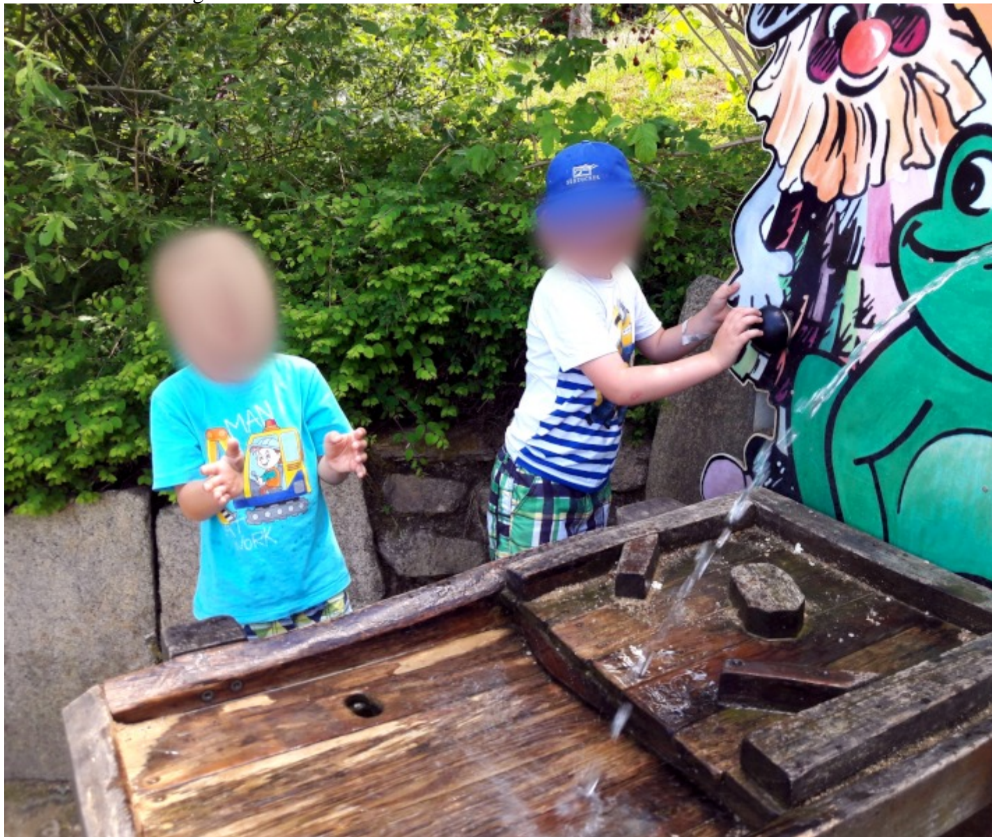
Kinder haben Spaß mit Wasser