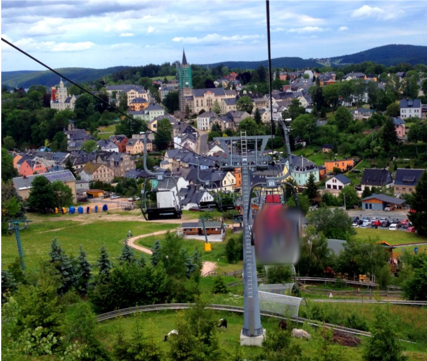
Blick vom Lift ins Tal