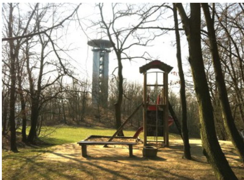
Unmittelbar vor dem Turm befindet sich ein Spielplatz.

Direkt in der näheren Umgebung befindet sich zur Erholung ein Spielplatz, sowie Tischtennisplatten.