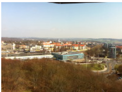
Blaues Bahnhofsgebäude im Nord-Osten