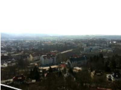
Aussicht auf noch mehr Häuser