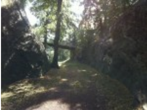
Rundgang um die Burg