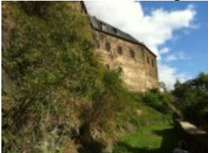
Gang vor der Burg