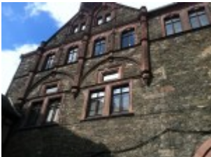
Nahansicht auf die Fenster