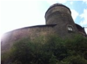
stolz erhebt sich der Turm