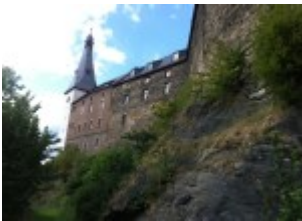
Wunderschöne Burganlage im Vogtland

Die Burg wurde um etwa 1180 erbaut. Prachtvoll ragt sie noch heute auf dem Berg empor. In der Burganlage befindet sich heute ein Museum.