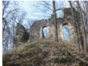
Die Reste der Ruine