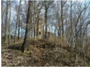
Majestätisch ragt die Ruine empor

Nicht mehr viel übrig, aber trotzdem noch mystisch steht die Burgruine auf dem Berg (wie einst alle Burgen) mitten im Wald.