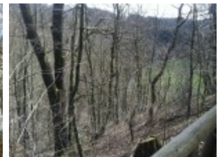
Die Burg steht mitten im Wald.