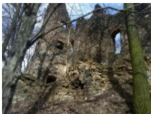
Ein Bollwerk von früher