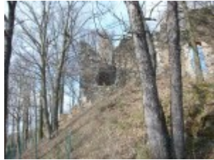
Die Burg wurde direkt am Hang errichtet.