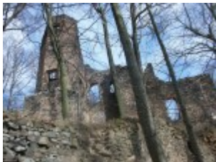
Damals war die Burg bestimmt uneinnehmbar...