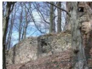
Die letzten Überreste