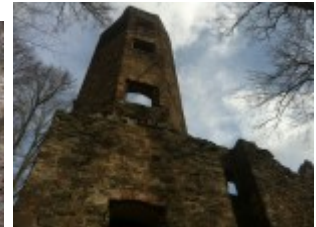
Der Burgturm ragt noch weit in die Höhe