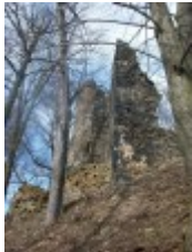
Viel ist nicht mehr übrig - aber immerhin!