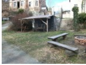
Passende historische Umgebung

Jetzt wohne ich nun schon über 30 Jahre im Vogtland und kannte diesen Ort bis vor Kurzem noch gar nicht. Diese Burg ist den meisten Bürgern eher unbekannt.