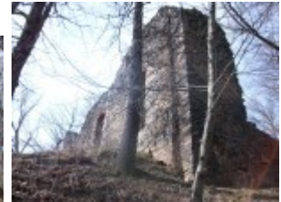
Nur noch das Erdgeschoss ist übrig geblieben.