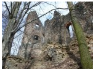
Alles aus Stein