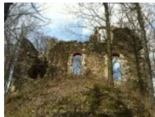
Die Ruine verfällt mehr und mehr