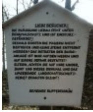
Hinweis- und Warnschild