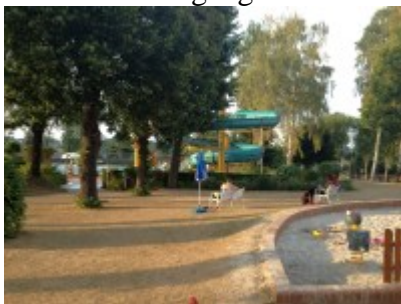
Abend nach großer Hitze