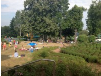
Blick vom Eingang

Wer aber nur ein Eis will (braucht ja keine Zubereitungszeit), kann ohne Wartezeit am benachbarten Ausgabefenster bestellen und erhält seine Bestellung sofort.