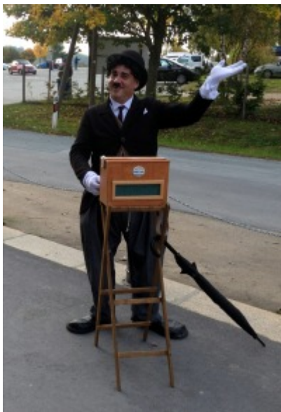
Komiker mit Drehorgel