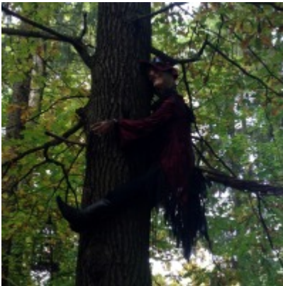
Hexe am Baum