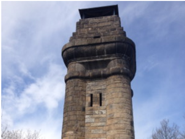
Kemmlerturm mit Eingang und Bänken