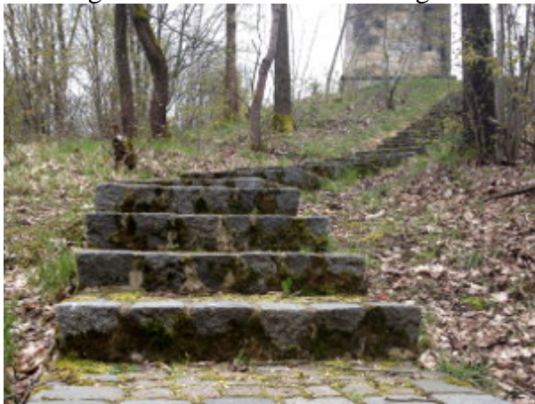
Majestätisch passende Steintreppe