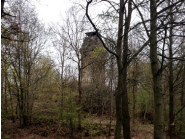
Aufstieg zum Kemmler aus Richtung Norden

Der Turm ist nach einer zweijährigen Schließung seit 2015 wieder täglich begehbar.