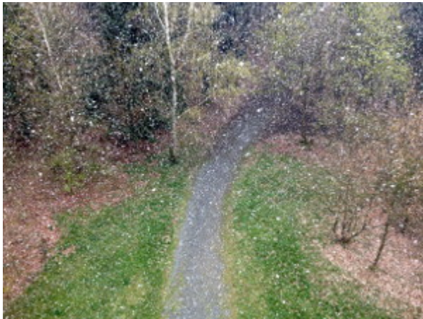
Blick vom Turm auf den Südaufstieg