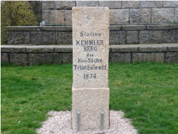
Station KEMMLER BERG der Kön. Sächs. Triangulierung 1876