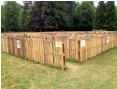
Start in den Irrgarten

Die Idee und die Umsetzung stammt vom Rützengrüner Heimatverein.