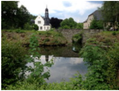
Schloss mit Schlossgraben