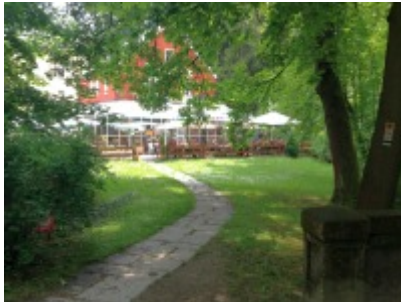
Blick auf ein Cafe