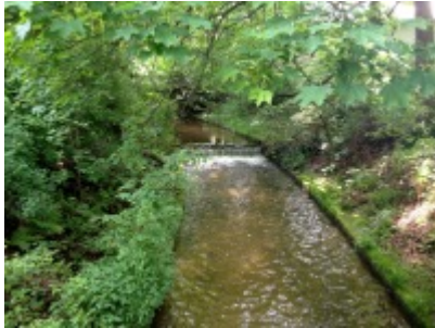
Fluß zum Teich

Auf dem Ententeich gibt es Ruderboote . Rund um dem Teich verlaufen Wanderwege . Cafes laden zum Verweilen ein.