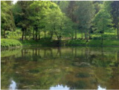
Teich mit Rundweg