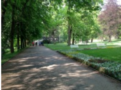
Großer Weg mit Blumenbeet

Homepage: http://badelster.de/de/touristinformation/stadtrundgang/louisa-see.html