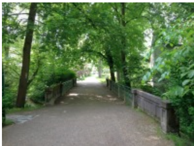
Brücke über Fluss