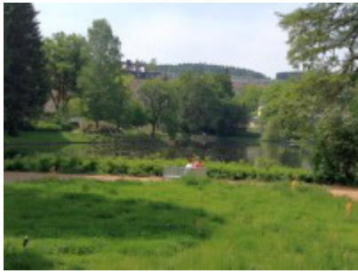
Weißer Gartenbank mit Pärchen