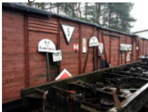
Schilder und Waggons