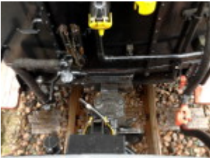
Zwei gekoppelte Waggons