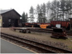
Lokschuppen und Gleise