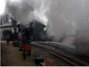
Warum die Dampflok Dampflok heißt