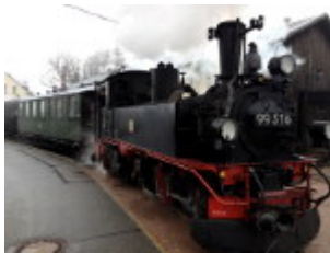
Im Bahnhof einfahrender Zug

Zur Eisenbahn gehört eine kleine Ausstellung am Lokschuppen. Auf Wunsch und Anfrage sind Führungen eines Vereinsmitglieds möglich.