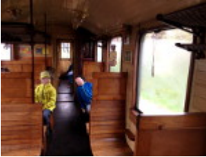
Das Innere eines Waggons