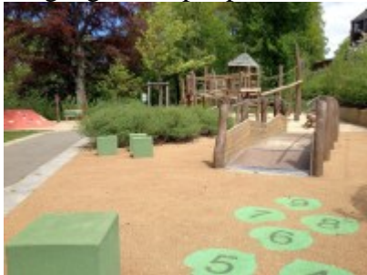
Wackelweg, auch für Rollstuhlfahrer geeignet