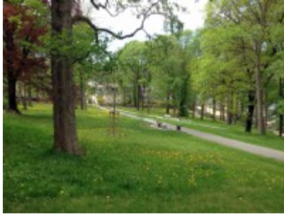
Erholsamer Stadtpark mit Wiese und Sitzbänken

Erholung im Auerbacher Stadtpark. Neben Wiese, Wegen und Bänken gehört auch ein Spielplatz und eine große Rutsche für Kinder zum Park. Nichtsdestotrotz, die Kinder spielen auch gerne auf der Wiese oder unter den Bäumen.