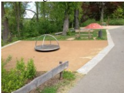
Drehscheibe und Kletterberg