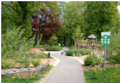
Eingang zum Spielplatz im Grünen