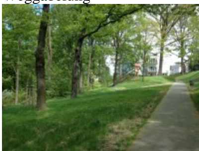
Weg durch das Grün nach oben