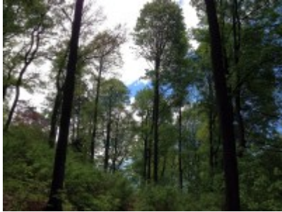
Blick in die Baumkronen