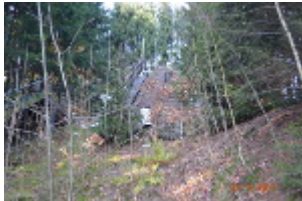
Große Schanze und kleine Schanze