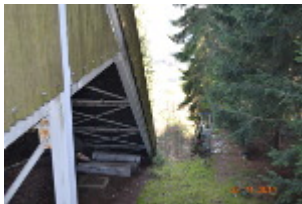
Große Schanze und rechts kleine Schanze