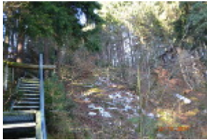
Aufstieg, Ampel und Beobachtungshütte