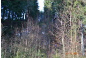
Ansicht von unten, vor dem Hang