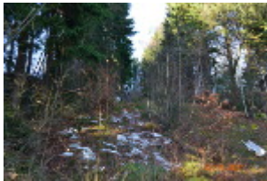
Ansicht von Weitem - Alles zugewachsen

Zu erkennen sind noch die Anlauframpe, der Sprunghügel, der die Aufstiegstreppe, die Startampel, das Schiedsrichter- und Wertungshaus sowie Reste der Matten. Folgende Aufnahmen sind vom 22. 11. 2014: