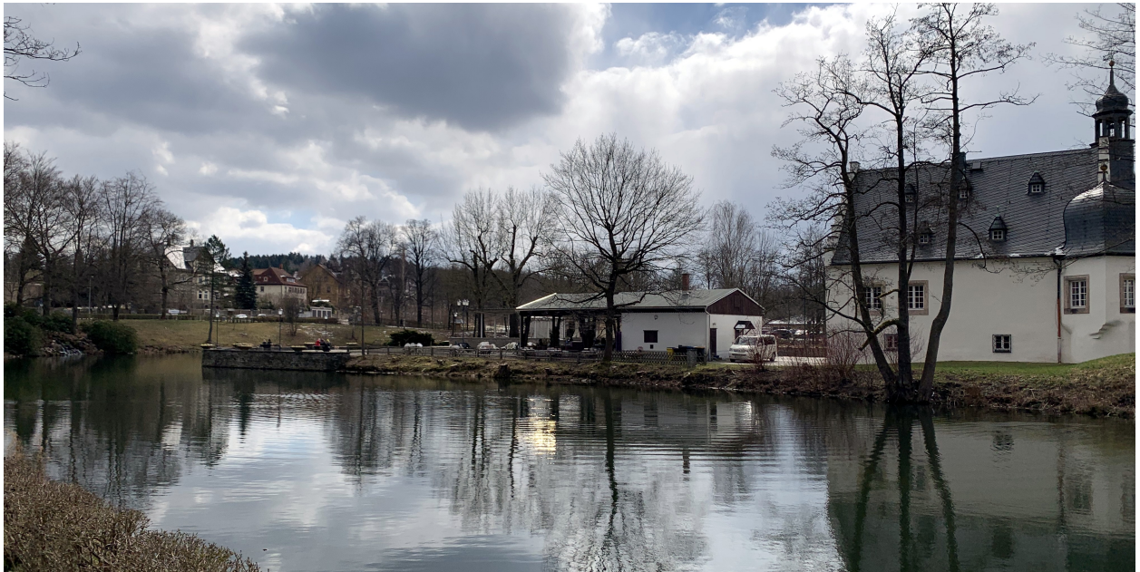
Burggraben vor der Schlossinsel - In der Mitte der Insel-Imbiss, rechts daneben das Schlößchen - 03. 04. 2022