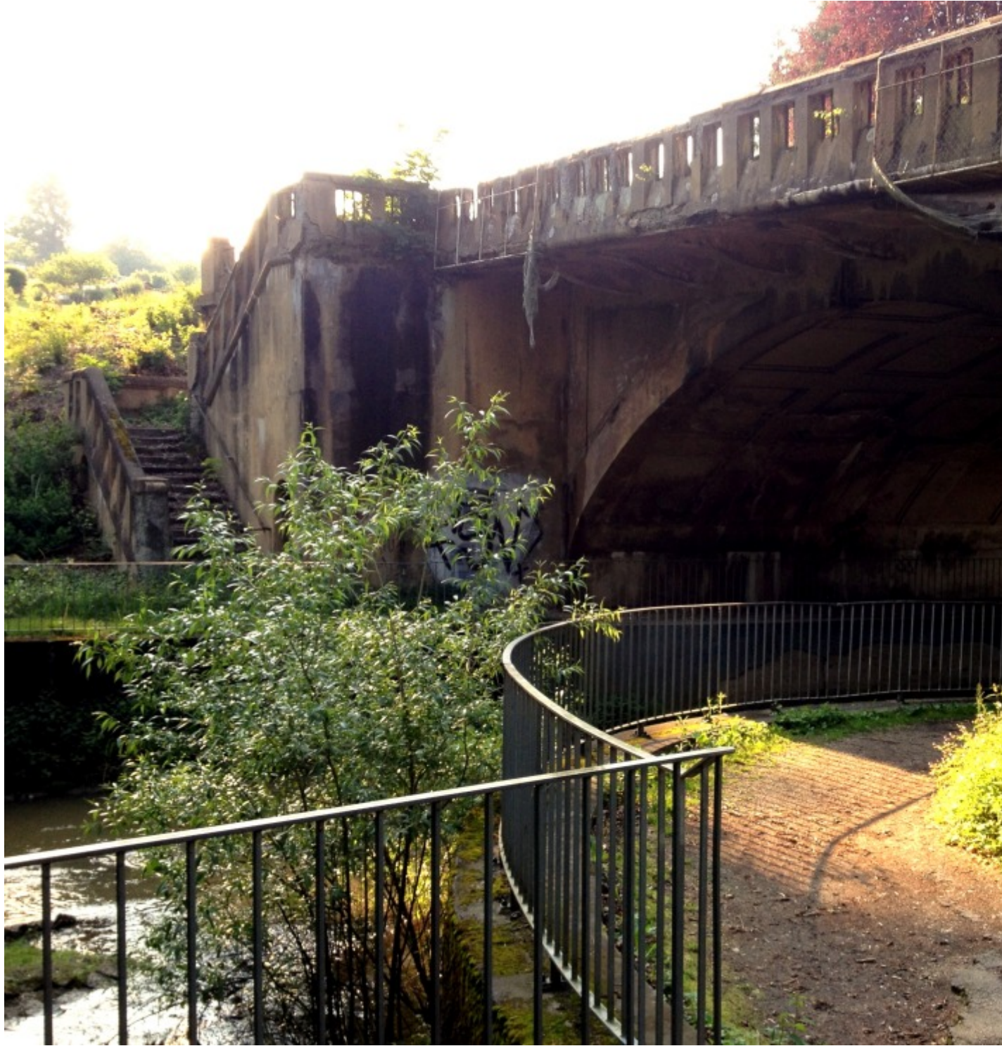
Ehemalige Rißbrücke - mittlerweile ersetzt durch die Parkbrücke mit den grünen "Stäbchen"