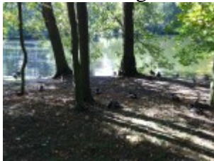
Enten am Ufer des Teiches