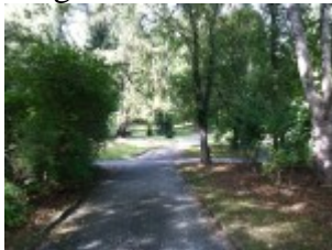
Viele Kreuzungen im Grünen