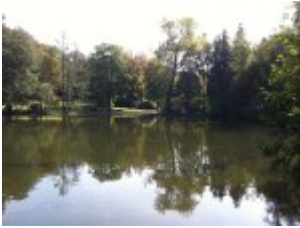
Blick über's Wasser