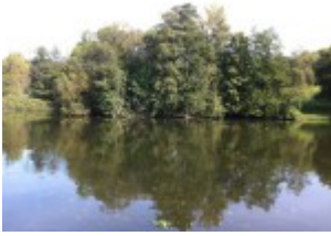
Bäume am Teich