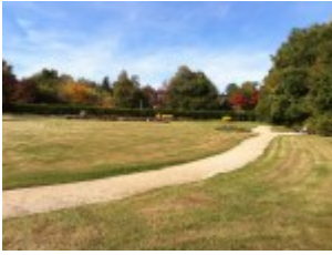
Weg zu den Blumen