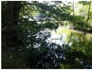
Blick durch Blätter auf's Wasser