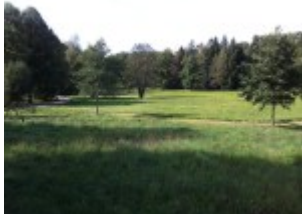
Weg in Wiese