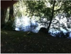
Ente schwimmt los