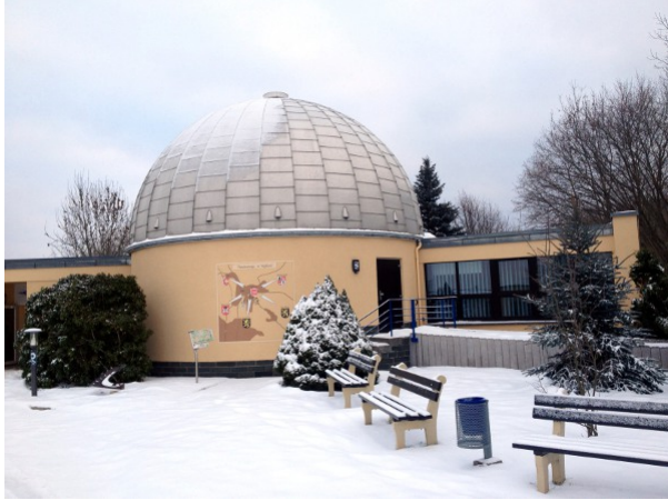
In dieser Kuppel befindet sich das Planetarium

Ein Planetarium ist eine bezaubernde technologische Erfindung! Man muss es einfach mal gesehen haben.